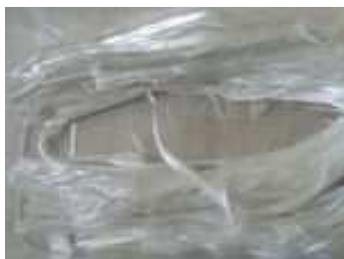
Fot. 1. Włókna azbestu

Już od czasów starożytności azbestowi przypisywano magiczne znaczenie ze względu na swoją nietypową budowę i właściwości. Etymologia słowa „azbest” wywodzi się z języka greckiego asbestion i oznacza „nieugaszony”, co wynika z jego właściwości fizykochemicznych. Azbest stanowi grupę minerałów o charakterze włóknistym, które powstały w procesach przemian metamorficznych skał magmowych. Budowa azbestu wykazuje giętą, połyskującą strukturę osiową o różnej długości i średnicy włókien, jednak są one na tyle cienkie i delikatne, że można je zaobserwować jedynie pod mikroskopem. Długość włókien azbestu oscyluje pomiędzy dziesiątymi częściami milimetra a 100 mm. Ingerowanie w strukturę tego minerału podczas różnych przeróbek mechanicznych powoduje rozdrabnianie się włókien na bardzo drobne włókienka zwane fibrylami. Pod względem chemicznym azbest jest uwodnionym krzemianem magnezu zawierającym w swym składzie różne metale. Azbest występuje dość powszechnie w środowisku przyrodniczym.