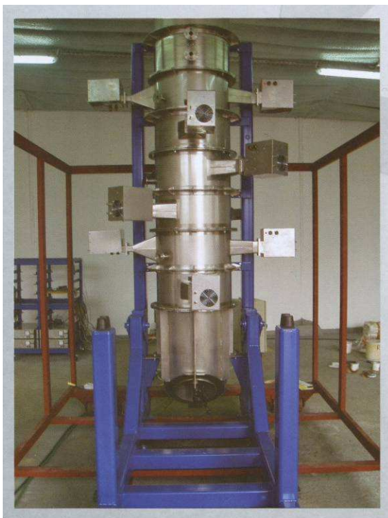
Fot. 3. Specjalna platforma z reaktorem spalania odpadów azbestowych pozwala na unieszkodliwianie odpadu w miejscu jego powstawania*