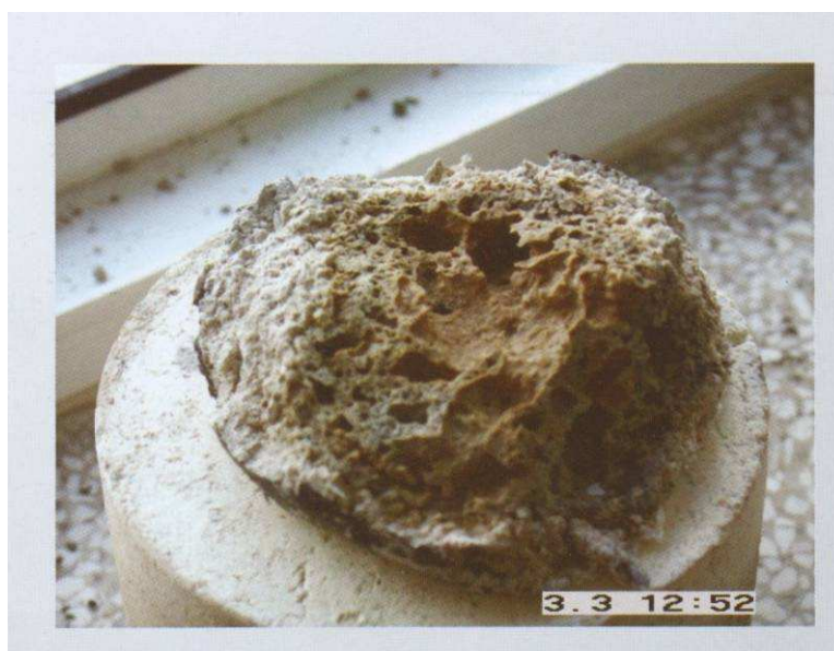
Fot. 2. Produkt po procesie spalania wyrobu zawierającego azbest – całkowicie pozbawiony szkodliwych włókien azbestowych

Zakład Ochrony Środowiska Instytutu Techniki Budowlanej w sprawozdaniu nr NS-581/P/05 na temat „Badania obecności azbestu w odpadach zawierających azbest, poddanych utylizacji z zastosowaniem technologii MTT” stwierdził, że odpady rozdrobnione z topnikiem zawierające azbest chryzotylowy, unieszkodliwione metodą MTT nie zawierają azbestu.